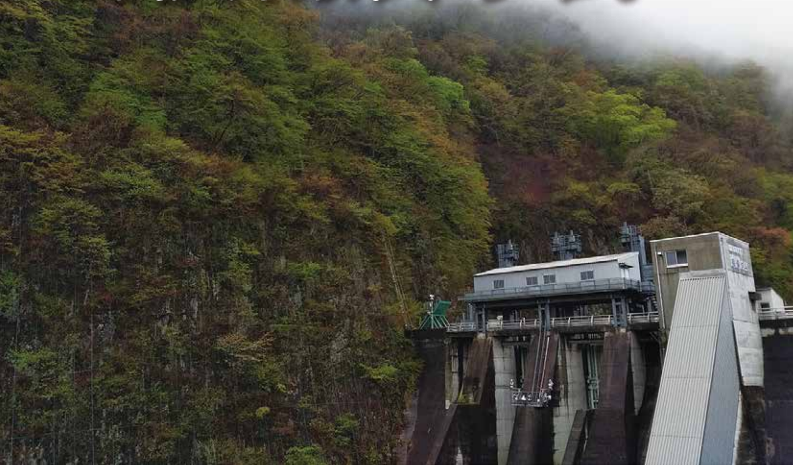
相俣ダム(群馬県利根郡みなかみ町)